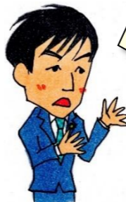
山添拓政策委員長

2022年の闇パーティー有罪事件でも、裏金の使い道は「表に出したくない高級な会食費」と「選挙で法定額を上回る分」との証言。ご存じでしたか