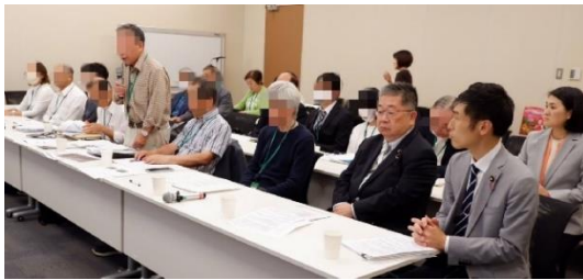
白井の住民から、国交省・環境省・総務省に問題点を訴えました。連帯する白井市議達と(右から)共産党の斉藤和子・元衆議院議員、山添拓・小池晃参議院議員、他党議員も参加(2025/5/23)

白井市議の根本あつ子です。いま、白井市内では、同時にいくつものデータセンター(Data Center、以下DC)が建設されています。AI時代の今、膨大な情報を管理するDCは社会に必要で、市に入る税金が増えるという面もあります。