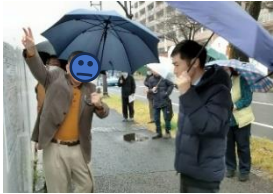
桜台と富ヶ谷DC予定地で、近隣住民の方の説明を受ける共産党の山添拓・参議院議員 (2025/3/29)